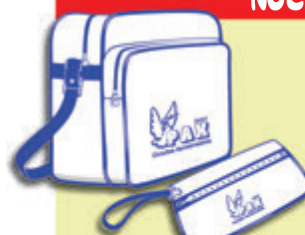
Bolsa y cartera documentación