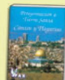
Libro de Cantos y Plegarias

Cada día se celebrará la Santa Misa en los lugares más significativos